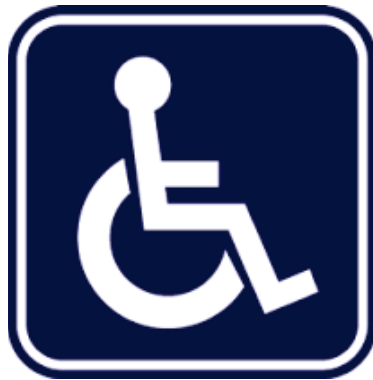
สัญลักษณ์ผู้พิการ